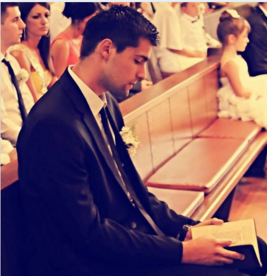
Фото: архів Світло Марії 2x

Уже через кілька днів я відчув, наскільки це буде нелегко. Спокуси посилювалися, а моє тіло все слабшало. Через два тижні хліб став мені смердіти, а на смак здавався землею. У кімнаті постійно розносився запах моїх улюблених страв, хоча я був один і жодної їжі в домі не було.