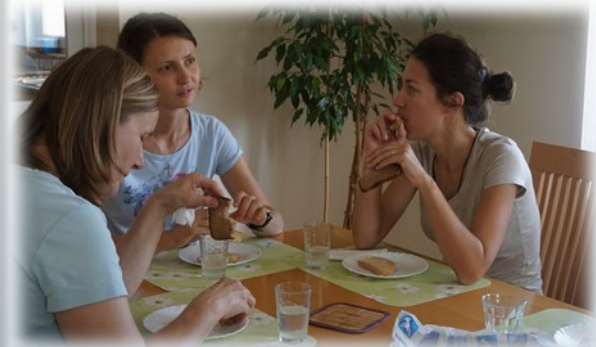
Фото: архів Світло Марії 2х

Якщо бажаєте приєднатись до нас у молитві чи отримувати газету, напишіть на mail: gospa3@gmail.com